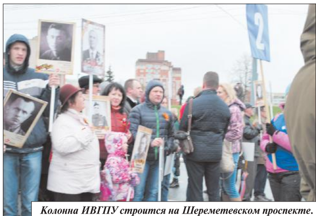
Колонна ИВГПУ строится на Шереметевском проспекте.

«Бессмертный полк» — это бессмертная память благодарных поколений о тех, кто пал на полях сражений за мир и спокойную жизнь потомков, за процветание Родины.